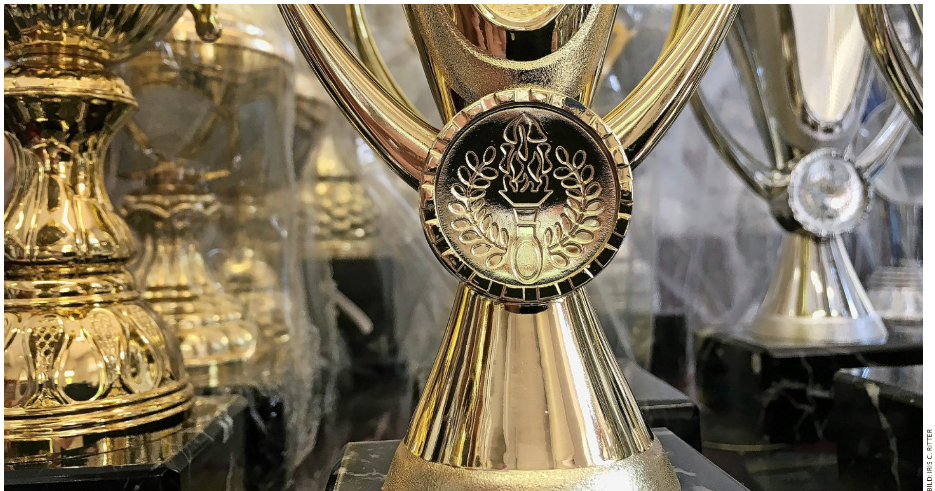
Ein Pokal für aktives Anlegen: 2020 war ein Jahr, in welchem sich gezieltes Investieren in bestimmte Aktien ausbezahlt hat.

So überrascht es nicht, dass im sogenannten Standardsegment bloss 40% der aktiv gemanagten Fonds in den vergangenen zwölf Monaten den SMI übertrafen. Jeder zehnte Fonds hat im Coronajahr gar an Wert verloren, darunter etwa Produkte der PostFinance, Swisscanto sowie der Berner und Schwyzer Kantonalbank. Zwar sind Einjahresbetrachtungen bloss Momentaufnahmen. Allerdings bieten gerade Krisenjahre den aktiven Managern die besten Chancen.